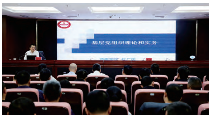
10月12日，集团公司党委举办党支部书记轮训班，邀请市委党校专家学者就“习近平新时代中国特色社会主义思想的创立背景、科学内涵、历史地位”以及“国有企业基层党组织建设”等内容进行专题辅导。集团公司各层级党支部书记参加轮训。（工宣）

读书班期间，集团党委领导班子通过集中学习、个人自学、现场教学和专题辅导等方式，推动习近平新时代中国特色社会主义思想真正入脑、入心、入行，持续夯实坚定拥护“两个确立”、坚决做到“两个维护”的思想根基。（工宣）