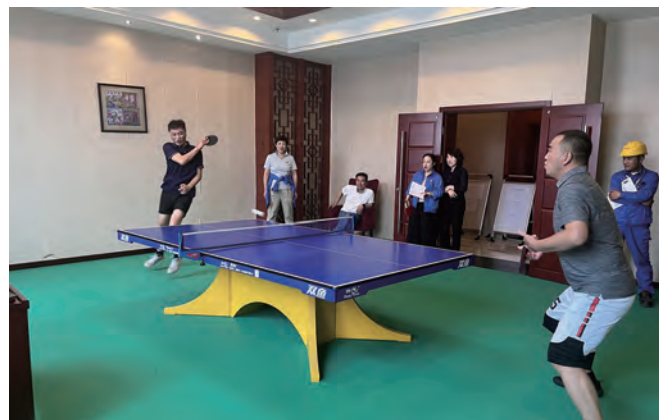
为丰富职工文化生活,增强职工身体素质,10月18日,利华化工公司举办“奋进新时代、建功大利海”乒乓球友谊赛,各部门20余名职工参加了比赛。(王静静)

涉及生产设备管理、工艺质量管理、安全环保管理、项目管理、后勤管理等多个方面,共收集到意见建议43条。经过两轮评审和适用性检测,最终评选出优质建议11条,如:检测时需要剥取的纤维改由生产车间回绕成卷装,一年大约能节省20000元左右;在数据平稳的前提下,经过技术评估,降低干燥出口纤维含水率检测频次,可减少试剂使用量,降低水浴加热、烘箱使用时间,全年预计节省电费6000元。本次活动围绕节能降耗,提升效率、提高质量,提高产品制成率,保证生产正常,形成较好的规模效应,推动企业效益增收。(神特宣)