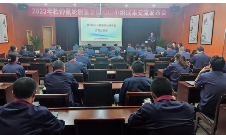
为全面贯彻质量提升战略,近日,杜钟氨纶公司召开第三届QC小组活动成果交流发布会,提高产品的一等品率、提高关键设备维护效率、细化生产工艺操作流程等15个课题参与评选发布。(李春花)

廉政熏陶递“廉香”。发挥廉政教育基地功效,科学搭建“线上”“线下”廉政文化阵地,“线上”:设立纪检微信群、QQ群等网络平台,利用“掌上纪律课堂”“清廉江苏”“山海廉韵”“学习强国”等开展“线上”教育。“线下”:紧紧围绕党风廉政信息化教育,更新廉政墙谱30余个、征集“贤内助”制作的廉政文化作品30余件;选送情景朗诵剧《家书》参加集团“厚植廉洁文化 打造廉洁工投”专题廉政党课;在市级刊物上用稿3篇、省级刊物用稿1篇,集团报刊、网站上用稿12篇,推动廉政文化活动深入开展。(陈健 郁恩祥)