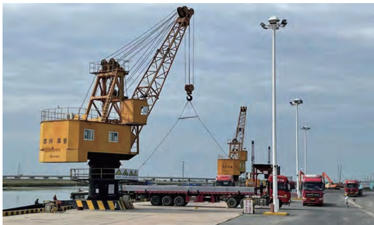
连日来,灌西外贸物流码头装载着管桩、绿化土、吨袋的车辆正有序进出,码头工人拉开扶梯登车、吊机挂钩、解钩,动作规范娴熟,将货物吊运装车……开足马力满负荷生产,掀起决战“四季度”大干热潮,截止目前,四季度已完成各类货物吊装近80000吨,实现营收40万元。(许东彦)

三进度,加大市场化工程承揽竞争力。深化业务延伸,提高营业广度。加快与国网的沟通合作,争取更多市场份额。着力发展增值服务,提高服务精度。通过做好电力供应、工程施工等基础服务,提升客户满意度,打响供电品牌,为公司推广运维服务聚力赋能,增加收益空间。顺大势、入大局,助推转型力度。加大对新能源、分布式发电、储能等清洁能源的相关学习,积极参与各园区新能源相关项目,由小项目入手,汲取经验,做足筹划,争取明年独立完成具有一定规模的、由公司总包实施的新能源方案,在新能源领域早日完成由“入局”到“做东”的转变,破局新赛道,提升“续航力”。(姜江)