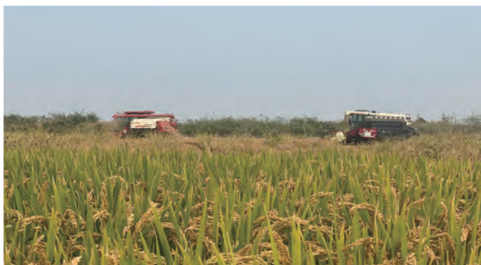
10月13日，青口投资公司大新农场50余亩新品种稻花香水稻迎来成熟期，开镰收割。在金色的稻田里，稻谷随着秋风翻起波浪，空气中裹挟着稻米的清香。轰隆隆的收割机来回穿梭在稻田之中“作画”，眼前呈现出一派丰收的忙碌景象。（王璐）