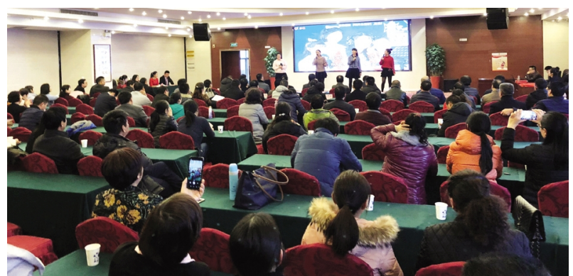
为庆祝改革开放40周年,日前,台北投资公司在金台大酒店10楼会议室隆重举办“汇聚台北旋律,唱响改革强音”歌唱比赛。来自各条战线140余名员工参加了活动。比赛过程中还进行了改革开放40周年知识互动抢答。(张会鹏)