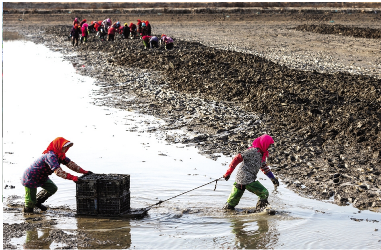
连日来,青口投资公司养殖池塘里工人们在起捕缢蛭等产品。近期,养殖户趁着水产品长势较好,及时清理在池的缢蛭类产品,利用晴天好天气,对池塘进行晒干消毒,巧打时间差,为2019年养殖池塘投放产品提升效益打下良好基础。(顾益)

创新工作室创新技术成果化“领头雁”作用,五寸管道、新型扒盐机等扒盐设备得到全面推广,出盐率达60吨/小时,效率提高171.43%,全年扒盐55万吨,取得显著经济效益;公司劳模安树林、王绪华分别荣获市职工先进操作法二、三等奖。“海水+矿卤”勾兑新式海盐生产取得突破,达产2万吨。完成“开山岛”品牌,果蔬泡洗盐、泡脚盐、水产养殖盐、热敷盐四个系列新品种盐“一牌四品”注册工作,在上海、浙江打开市场,已销近2000吨。(季兴胜)