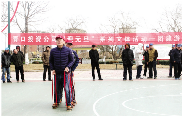
12月25-28日,青口公司开展迎“元旦”系列文体活动,包括“爱国电影观看”“卡拉OK”大赛、团建游戏、扑克牌比赛等项目,员工们在欢声笑语中迎接新一年的开始。(王玲)

营造文化氛围,激发工作活力。举办“劳动成就梦想”庆“五一”文艺汇演,展示青口新形象;组织“盐田玉”杯越野长跑比赛,激发全民健身热情;开展“迎元旦”系列文体活动;女工委开展读一本好书、推荐一篇好文章、写一篇心得体会“三个一”读书活动,召开女工读书交流会、分享会,营造“书香青投”的文化氛围。(王玲)