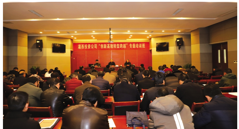
为提高管理人员的综合素质,加快推进公司创新转型发展。12月19日上午,灌西投资公司中层管理人员共60人在灌云县委党校进行了为期两天的“创新高效转型跨越”专题培训学习。(张明建)