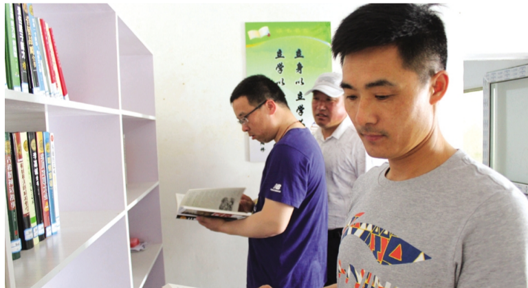
黄化制钙公司重新整修“职工书屋”,及时安装空调等设备,购置更新更贴近职工需求的书籍。5月16日,职工书屋再次“开门迎客”,首日借书量达到了20余本,同时开展读书漂流活动,鼓励员工捐赠好书,增加藏书量。(刘凡榕)