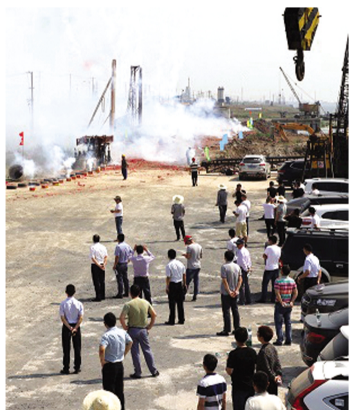
5月16日上午，灌西宵湾物流公司五灌河码头二期扩建工程开工仪式在码头施工现场举行，此次二期工程为扩建工程，项目总投资约1900万元，预计工期为100天，建设内容包括：2个300吨级(结构兼顾500吨级)泊位和11000平方米后方陆域堆场，码头泊位长180米，宽20米，年设计吞吐量为100万吨。(封杨)

抓清单考核。制定“责任履职清单”，根据岗位职责，制定员工岗位责任履职清单，一人一单，作为日常考核和年度考核依据；下达“任务指标清单”，重点对单位、部门下达阶段性工作任务，以考核表单形式进行网上公布，强化公开监督考核力度，提升工作效率；实行“落实考核清单”，按季度、半年、全年三个时间节点，由绩效考核小组对单位、部门和个人落实清单情况进行考核测评，考评结果及时网上通报，按分值高低增减当月收入。(杜娟)