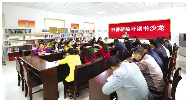
5月11日下午,为持续营造全民阅读的学习氛围,不断增强职工从业素质和职业技能,徐圩投资公司女工委、团委联合开展的“书香徐圩”读书沙龙活动在机关阅览室举行启动仪式。来自公司不同工作战线的30余名优秀女工、青工代表一起参加启动仪式。(戴月婷)

一是以学习贯彻党的十九大精神为抓手,把思想教育贯穿于全年学习教育,加强主题思想政治工作,全面提升员工思想政治素质。二是组织并积极引导员工参与主题为“开拓创新促发展、扭亏增盈求突破”劳动竞赛活动中,围绕公司总体经营目标,在各部门和全体员工中开展以“四比四看”、“四讲四促”为主要内容的竞赛活动。三是开展丰富多彩的职工文化体育活动,开展了“生日送祝福”活动,每一名职工在生日当天都能收到生日蛋糕卡和祝福鲜花;以“健康生活、快乐工作”为主题,组织员工参与全民健身活动;打造“读书角”,给每一名员工留一份阅读园地;关爱女职工,定期组织女工读书会活动,进一步提升女工政治和文化素养,打造智慧女性。(郭坤)