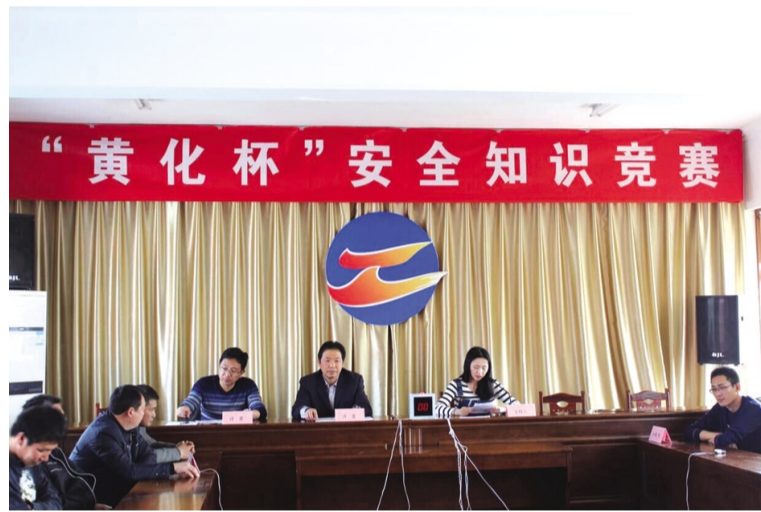
近日,黄化制钙公司针对化工行业安全生产的特点和现状,举办了开车前安全培训及“黄化杯”安全知识竞赛,促进公司安全生产工作进一步规范化,促进广大员工提高安全意识,掌握更多的安全生产知识。(赵丹)

化解风险机制,促进经营良性运行。该公司坚持问题导向,实行风险预判,降低运营风险,强化市场运行,与大合作商签订订单农业,与农机合作社签订规范协议;压缩生产性借款额度,严格审核把控借款人条件,确保发的出、收的回;坚持企业经营运行月度、季度性分析,对重点工作实行表单元化考核。采取管理外化手段,对认标制种植实施农机作业、农资采购、“一卡通”等全程监管,实行派驻工作组制,对当前重点工作进行跟踪指导服务,确保重点工作有效落实。(卢忠歌)