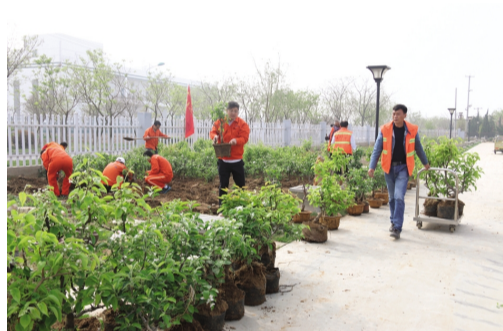
4月2日上午,华茂公司机关党支部组织党员志愿者到盆景园义务奉献劳动。多名党员志愿者起创培植在苗床里越冬水菜花、修剪养护,除了个温室大棚和10多池苗床里生长的杂草,图为党员在起创搬运水果盆景。

了一批“廉政督导员”制度,进一步畅通监督渠道;未雨绸缪“常思远”,两个责任“重落实”。认真梳理提炼“两个责任”的实质内涵和工作要求,狠抓“两个责任”贯彻落实情况,坚持业务工作和党风廉政建设同部署、同考核、两手抓、两手硬;强化监督“常警醒”,发现苗头“早警示”。为加强中层管理人员的日常管理和监督,开展对中层管理人员进行约谈和函询活动,确保干部严守纪律规矩,党风廉政建设走上新台阶。 (房宣)