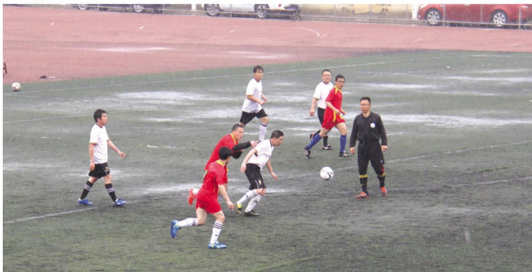
4月份以来,利海化工公司组织成立足球社团和健步走社团,旨在通过社团活动丰富和充实员工业余文化生活,展示利海员工积极向上、乐观进取、团结奋进的精神风貌和良好的企业形象。图为利海足球社团组织社员参加“建设健康连云港”2016年连云港市职工足球比赛现场。(顾孟鑫)

细管理、技术攻关、降本增效”实绩争创上来,积极围绕小项目、小工程施工作业开展小革新、小发明等业务竞赛和技术比武活动,加大对水质、现场、成本、服务等竞赛指标的考核力度,有效提升“安全、优质、低耗、文明”工作水平,并通过大力宣传技术能手和服务标兵先进,促进经营效益和服务水平双提升。(季东生)